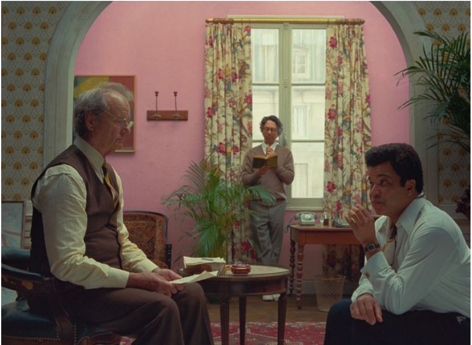
The French Dispatch (Anderson, 2021)

riportare lo strano sotto il mantello del familiare – un pericolo, questo, intravisto acutamente da Mark Fisher –, riconducendo piuttosto l’immagine al «Fuori dei processi a cui ogni vita soggettiva è rimessa» ( ivi , p. 12).