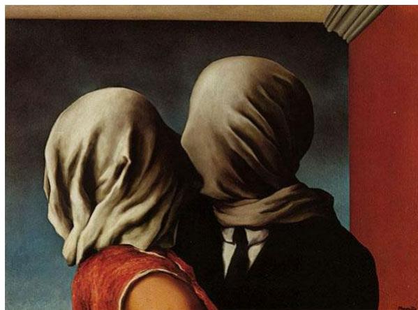
Magritte, Les amants.

Questa radicalità porta con sé altre due tesi radicali, vale a dire quella di un materialismo attualista e non di un materialismo sostanzialista e quella dell'autismo dell'Uno come pulsazione apertissima e non come chiusura mortifera.